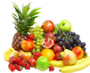
Netwerkstructuur: een appel is fruit