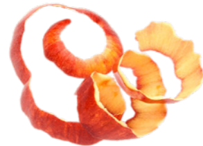
Concept: rood eten kauwen gezond de schil