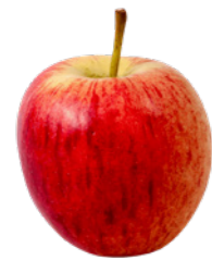
Label: de appel

Kinderen die in hun eigen taal de betekenis van een woord al kennen, het concept begrijpen, hoeven eigenlijk alleen het nieuwe Nederlandse label te leren en te onthouden. Zij leren een woord sneller dan kinderen die ook in hun eigen taal niet bekend zijn met het concept van het woord. Denk bijvoorbeeld aan de woorden tafel en stoel. Deze woorden zijn redelijk universeel en ieder kind zal weten wat je ermee kunt doen. Anders is het met woorden als orkaan of zee. Het aanleren van deze woorden kost dus meer tijd en zal ook andere werkvormen vragen.